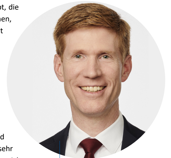
Roman Simon, © Roman Simon

Ich bin seit 2011 familienpolitischer Sprecher der CDU-Fraktion im Berliner Abgeordnetenhaus und wurde bereits im Vorfeld der Veranstaltung dankenswerterweise mit sehr vielen Informationen versorgt. Gern möchte ich in meiner Stellungnahme die aktuelle Situation für die