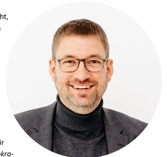
Lars Düsterhöft, © Lars Düsterhöft

Ich habe mir darüber Gedanken gemacht, was Familien mit versorgungsintensiven Kindern wirklich entlasten würde, und ich komme zu dem Entschluss, dass das System in dieser Stadt funktionieren muss. Es darf nicht immer wieder Hürden geben, die es aber an vielen Stellen immer noch gibt. Es ist in unserem Hilfesystem unglaublich schwer überhaupt den richtigen Weg zu finden und dabei sind wir mehrheitlich fast alle hier geboren, wir sind also aufgewachsen mit dieser Bürokratie und verstehen grundsätzlich, dass es unterschiedliche zuständige Ämter gibt.